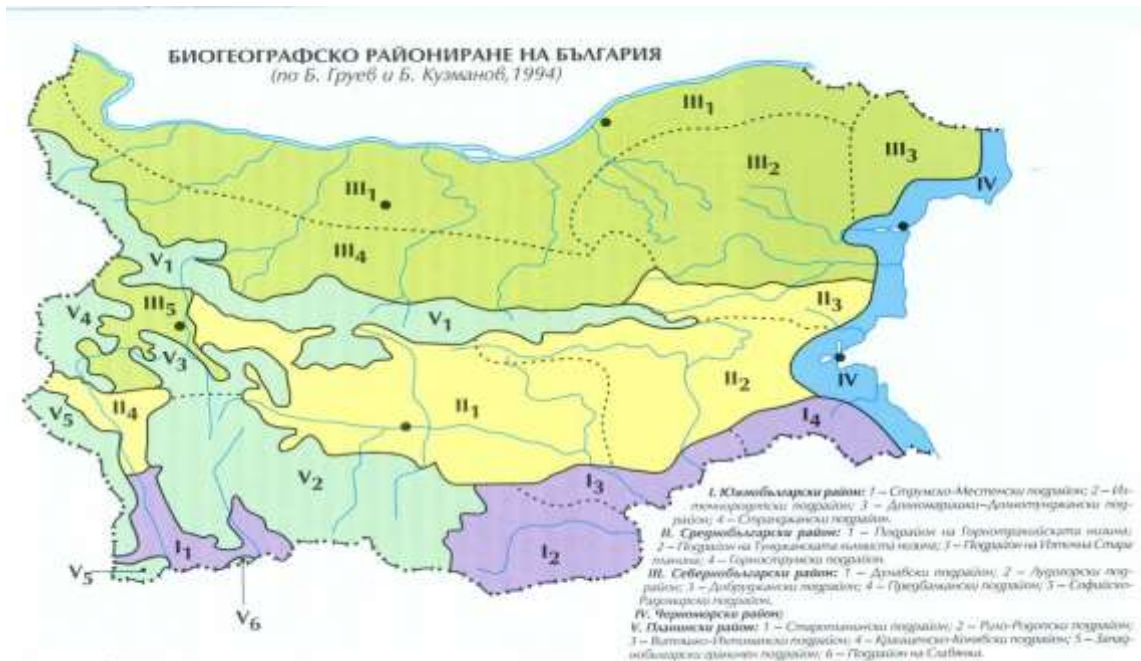
Фигура 1: Биогеографско Райониране на България

По данни от Лесоустройствен проект (ЛУП) за Държавно лесничество (ДЛ) “Търговище”, 2003 г., защитените територии (над 5 km) включва природни забележителности: